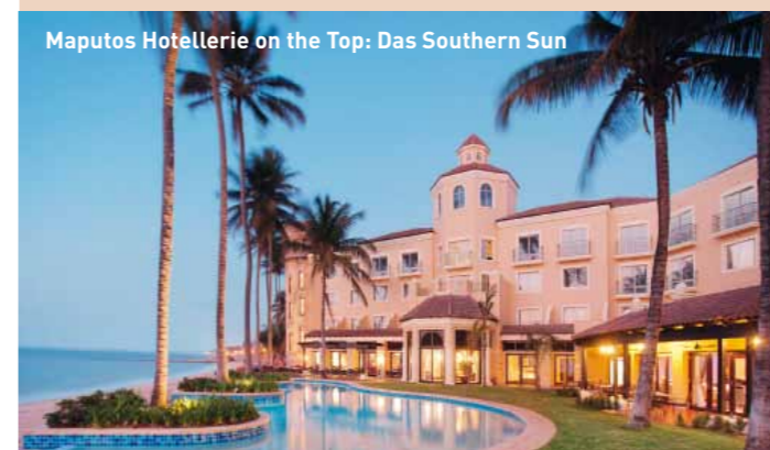
Maputos Hotellerie on the Top: Das Southern Sun

Mozambique tourism, www.visitmozambique.net